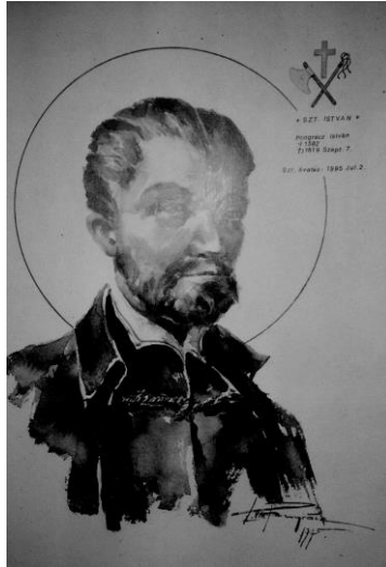
Szent Pongáczt István

A kassai vértanúk boldoggá avatási eljárását még 1628-ban indította el Pázmány bíboros, de az csak 1905-ben vezetett sikerre, amikor Szent X. Pius pápa január 15-én népes magyar küldöttség jelenlétében engedélyezte nyilvános tiszteletüket.